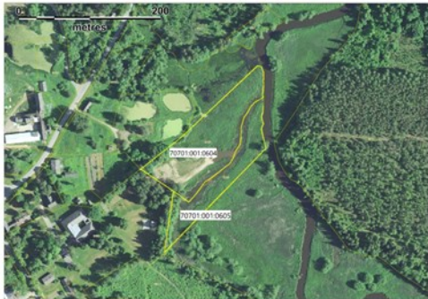
Joonis 1. Kavandatava tegevuse asukoht Ruusa külas

Kavandatava tegevuse eesmärgiks on rajada Põlva maakonda Räpina valda Ruusa külla Võhandu jõe äärde puhkeala. Kavandatud tegevused jäävad Ruusa küla üldkasutatava maa sihtotstarbega Puhkeniidu kinnistutele (70701:001:0604, 70701:001:0605). Esimese etapina kavandatakse Võhandu jõe endine harujõgi puhastada settest ca 3 900 m 3 ulatuses ning väljakaevatav sete planeeritakse kaldale madala liigniiske ala täiteks.